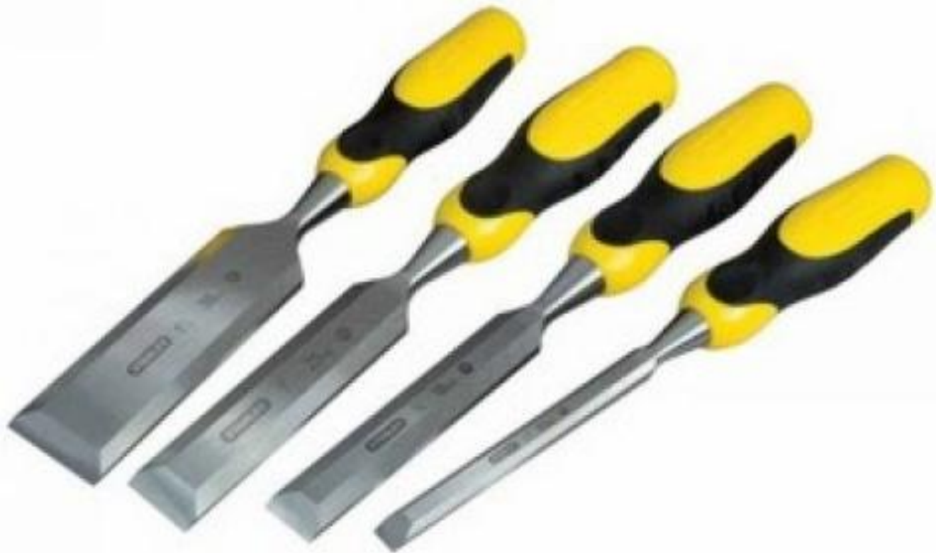
Рис 1 Стамески

плотной материи или в полевой сумке. Чтобы случайно не оставить копалку на месте сбора, в рукоятку можно продеть шнур и привязать ее к поясу.