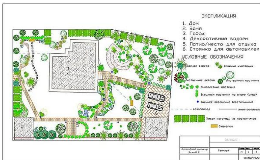
Рис. 2. Генеральный план (Формат А3)

Пример первого графического листа форматом А3 с горизонтальной ориентацией, в которой представлен генеральный план объекта, показан на рис. 2.