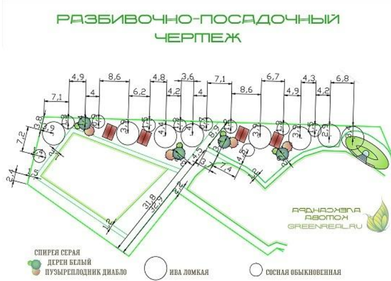
Рис. 4. Разбивочно-посадочный чертеж

Пример представления разбивочно-посадочного чертежа представлен на рис.4.